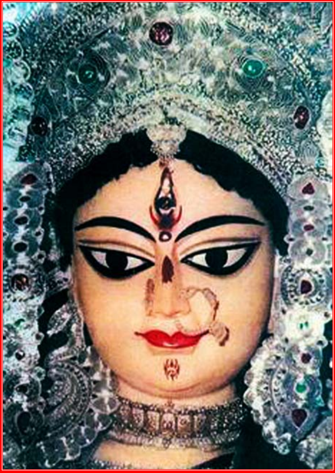
ஸ்ரீ தூர்கா ஸப்தச'தீ (சண்டி பாடம்)